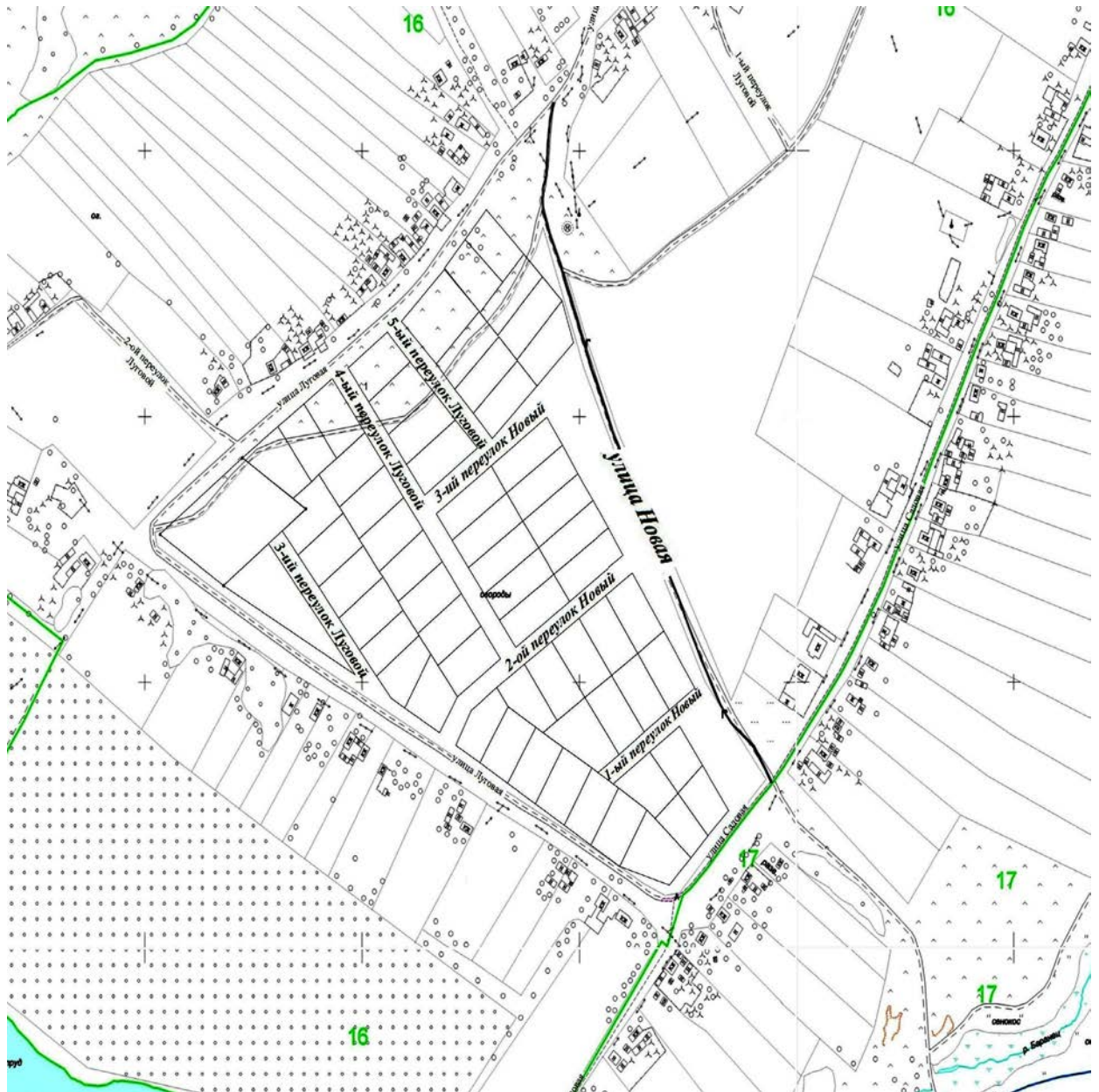
Схема переулков и улицы в селе Солдатское Старооскольского района Белгородской области